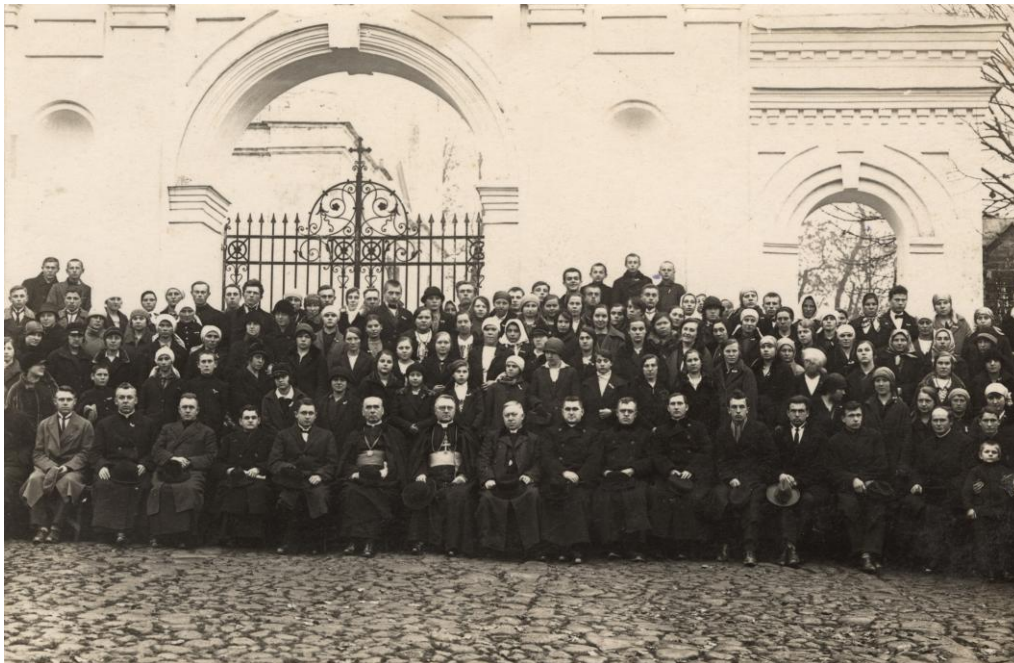
Telšių pavasarininkai su Vyskupu J. Staugaičiu.

mes jau turime pradėtą tvarkyti armiją. Vyriausias jos štabas – tai Katalikų veikimo centras. Tasai štabas yra mūsų vyriausios vadovybės – Vyskupų priežiūroje. Toliau, lyg kad atskiri pulkai, eina įvairios katalikų organizacijos. Jos neva veikia, bet trūksta joms gyvumo. Katalikiškasis jaunime! Stok į tų pulkų eiles! Nešk į jas savo drąsą, savo karštį, savo pasišventimą! Nepasitenkink tik viena savo, pavasarininkų, organizacija. Eik visur, kur gali bet ką gera padaryti. Eik į blaivybę ir per ją naikink didžiausią mūsų šalies priešininką, jos gėdą – girtuokliavimą. Eik į spaudą ir per ją naikink Lietuvos tamsybes, naikink klaidas. Negali pats rašyti; bet to ir nereikia. Uoliai platink kitų parašytą žodį – kat. laikraščius ir knygas. Šiandien jau, dėkui Dievui, rašytojų mums netrūksta, bet trūksta skaitytojų“.