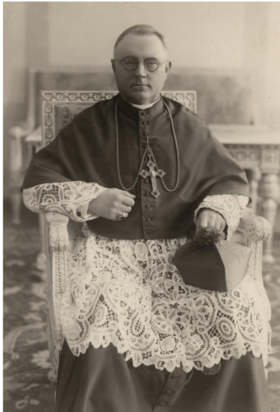
J.E. Telšių vyskupas Justinas Staugaitis. Apie 1934 m.

Prieš 150 metų, 1866 m. lapkričio 14 d. Tupikuose, Žvirgždaičių valsčiuje, Šakių apskrityje gimė Justinas Staugaitis – dvasininkas, visuomenės veikėjas, Lietuvos Nepriklausomybės Akto signataras. Pasirinkęs dvasininko kelią, jis negalėjo likti nuošaly, kai budo lietuvių tauta, kūrėsi Lietuvos valstybė. Savo atsiminimuose J. Staugaitis rašo: „Turiu pasakyti, jog mano gyvenimas taip susidėjo, kad vis reikdavo ką pradėti. Antai pradėdamas kunigauti, dirbau nedidelėse miestelių parapijose [...]. Paskui teko dirbti dideliuose miestuose (Lodzė, Varšuva) Lenkijoje, kur visai kitokios gyvenimo sąlygos. Ten reikėjo pereiti į gimnaziją kapelionauti, kur vėl visai kitokie uždaviniai. Parvykau Lietuvon, čia, Marijampolėje, teko grumtis su Bažnyčia puolančiais laisvamaniais („pirmėiviais“) ir skubiai organizuoti katalikų visuomenę, kad ji lengviau galėtų atsispirti prieš laisvamanus“.