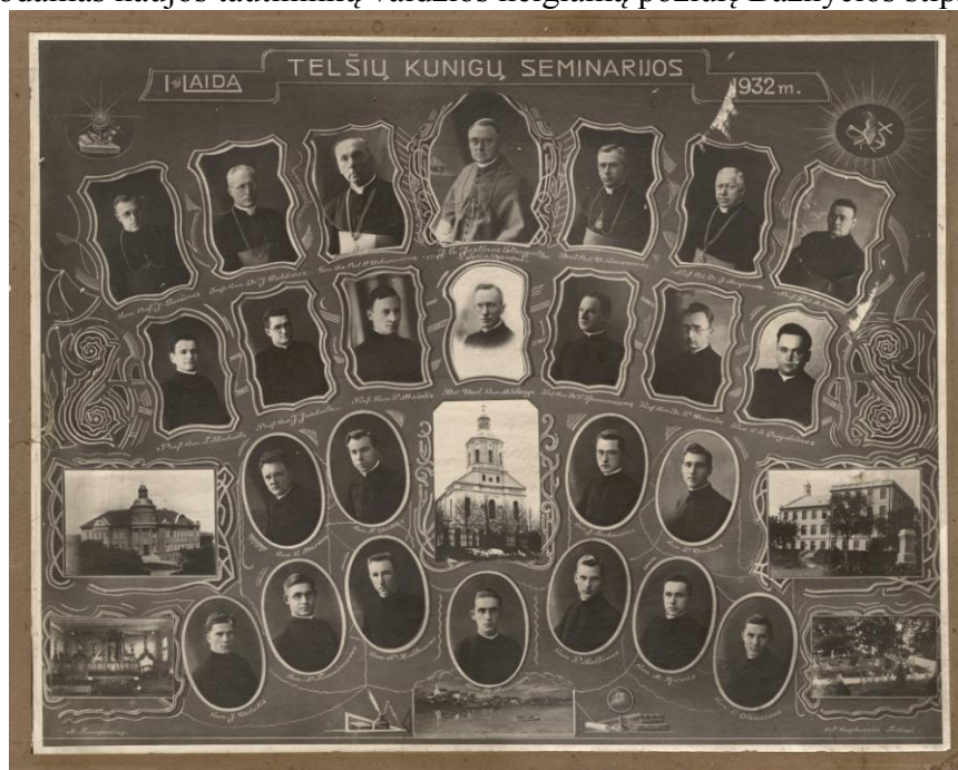
Telšių kunigų seminarijos I laida. 1932 m.