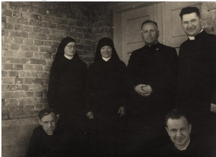
Vyskupijos spaustuvės darbuotojai