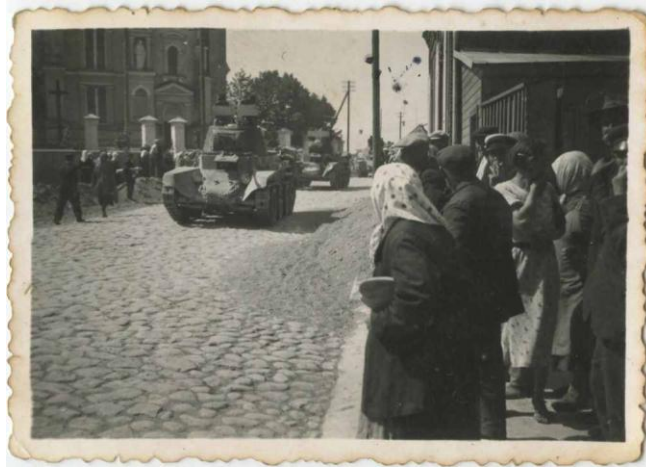
Pirmieji sovietų tankai Joniškio gatvėse. 1940-06-17.